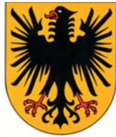
Zell am Harmersbach

Angelika Börnert Stadtverwaltung / Kultur