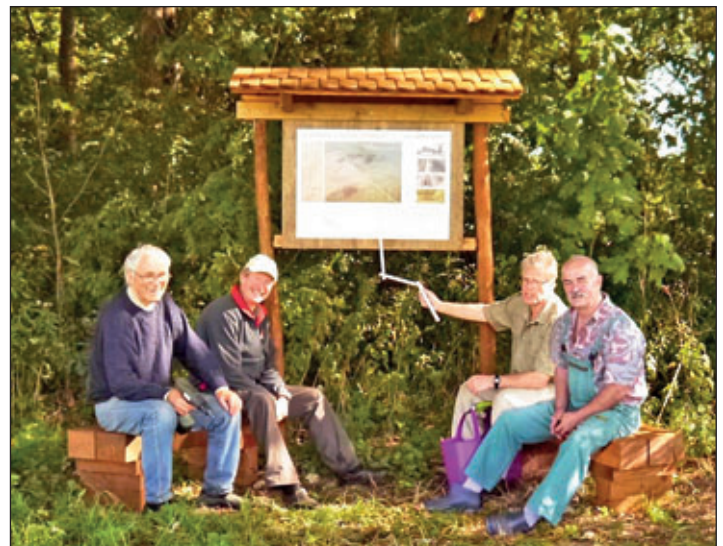
Bergbaufreunde aus Reichenau

Nun setzen die „Bergbaufreunde“ und der Verein alles daran, dass der Göpel 2018 auf einem 2. Haldenfest eingeweiht werden kann. (Fortsetzung folgt)