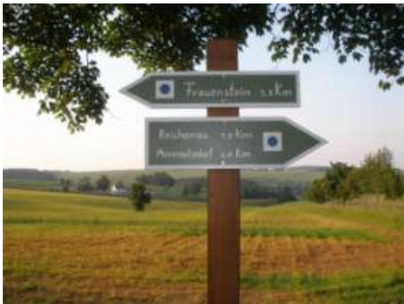
Abb.: Nach Reichenau

Man erreicht die Bundesstraße B171 und überquert diese. Am „Kuttelberg“ lässt man die verfallenen Garagen links liegen und folgt dem Feldweg/Kirchweg bis dieser eine Teerstraße erreicht.