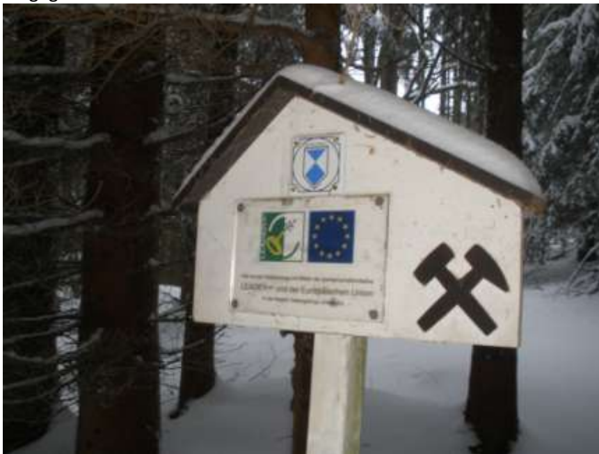
Abb.: Tafel an der Silberwäsche

Wenn man die Bundesstraße erreicht und überquert hat, geht man den breiten Talweg weiter und erreicht die alte Silberwäsche von 1600 bzw. das was Dieter Geißler mit seinen Kameraden wieder ausgegraben hat.