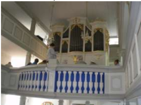
Abb.: Silbermannorgel Nassau

Am Röthenhübel steht eine Wanderhütte. Die lässt man rechts liegen und erreicht die Turnhalle von Nassau. Man geht aber nach rechts zur Dorfstraße und diese bergan. Hier findet man die Bäckerei mit Ausschank. Wer Glück hat und zur Kirche findet, kann sie evtl. besichtigen. Sieberherbergt eine Silbermannorgel. Man muss etwas aufpassen, um den Weg zum ehemaligen „Nassauer Hof“ zu finden. Dort überquert man die Bundestraße und geht ins Mäusebachtal hinab.