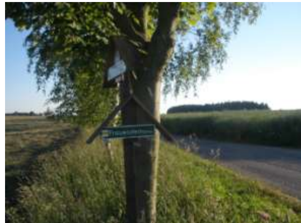
Abb.: Wegweiser an der Europastraße