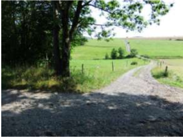
Abb.: Weg zwischen „Zwei Bäumen“