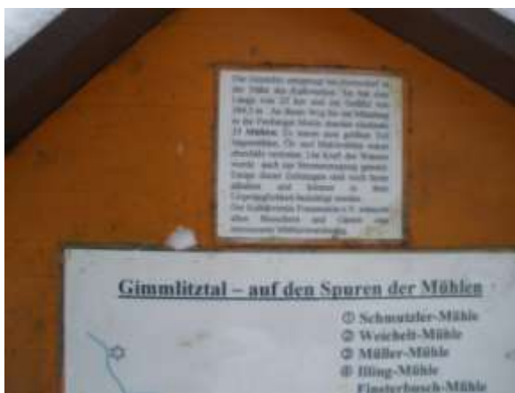
Abb.: Tafel zur Mühlentour

Hier stehen die Tafeln für den Überblick der einstigen Mühlen bzw. für die Walkmühle. Man nimmt den roten Weg nach rechts und erreicht bald die Pfarrbrücke, die man auf dem jetzt ausgezeichneten blauen Weg überschreitet und später die Schutzhütte „Marktsteig“ erreicht.