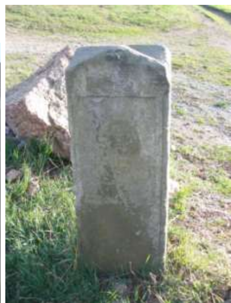
Abzweigstein, alter Standort

Wenn man am letzten Haus, dem Gehöft „Grohmann“ angelangt ist, heißt es Achtung.