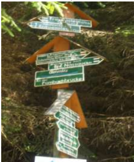
Abb.: An der Pombachbrücke

Über die Schreibweise gibt es keine Einheitlichkeit. An vielen Stellen findet man das „B“, weil der Sachse kein „P“ spricht. Der Name geht aber auf den Förster Pombach zurück, der wesentlichen Anteil an der Schaffung des Frauensteiner Schlossparks hatte, auch wenn der Park heute in keinem schönen Zustand ist, besseres Naturschutzgebiet wegen der Türkenbundlilie.