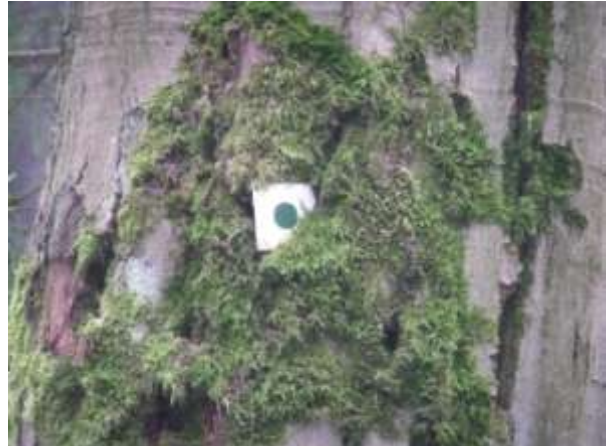
„Orientierungspunkt“ nach links

Wer diesen Punkt nicht findet, geht bis auf dem Kamm und dort nach links. Der Weg zum Röthenhübel ist nicht zu verfehlen.