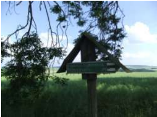
Abb.: Abzweig langer Weg

weist ein leicht versteckter Hinweis auf den Abzweig nach rechts hin.