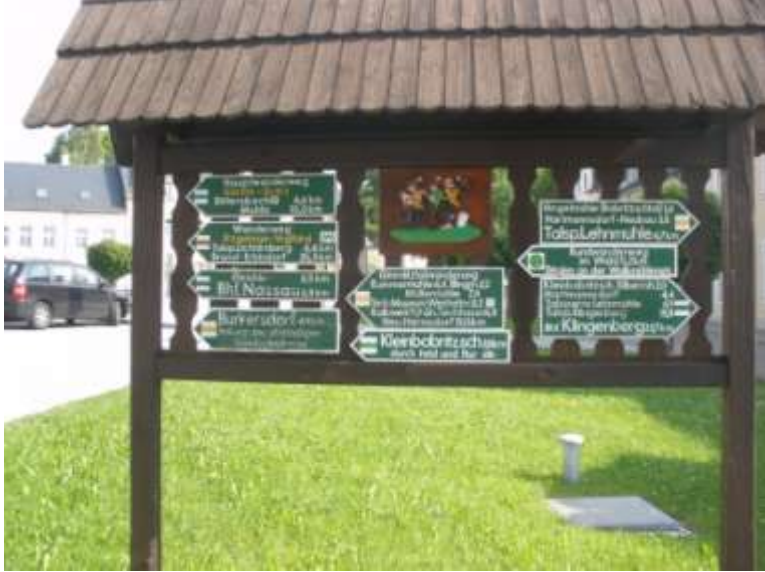
Abb.: Wegweiser am Marktplatz

Vom Marktplatz Frauenstein „grün“ nach rechts in die Wassergasse, dann links in die Hospitalgasse.