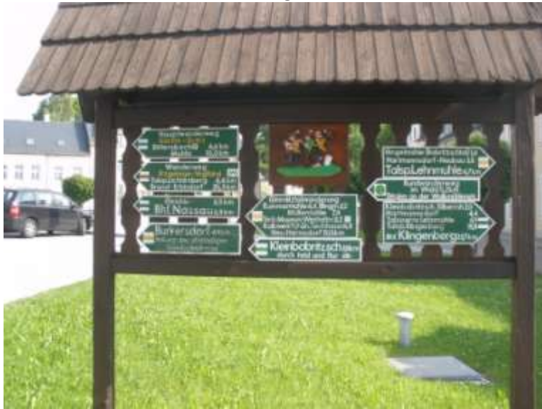
Abb.: Wegweiser am Marktplatz

Vom Marktplatz Frauenstein „rot“ nach links in die Freiburger Straße, am Frauensteiner Hof links in die Walkmühlenstraße. Dieser folgt man bis ins Tal, ca. 1,5km