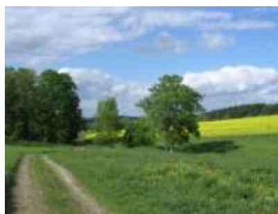
Halde vom Friedrich-August