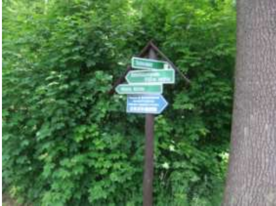
Abb.: Abzweig Schönfeld

Staatsstraße bis zum Buschhaus oder „Grüne Tanne“, wo man auch einkehren könnte. Wer sich aber auf eine Einkehr einlässt, der sollte vorher geklärt haben, ob eine Gaststätte geöffnet hat. Nichts ist schlimmer als Durst und Hunger, den man nicht stillen kann. Man geht also bis zum „Buschhaus“ und kann dort auch in den Bus einsteigen. Geht man weiter so sollte ein Stück Staatsstraße abwärts gegangen werden. Dann erreicht man direkt an der Straße die „Wüste Kirche“ von 1384. Es steht zwar nur noch ein Gedenkstein, aber auch Tafeln mit entsprechenden Informationen.