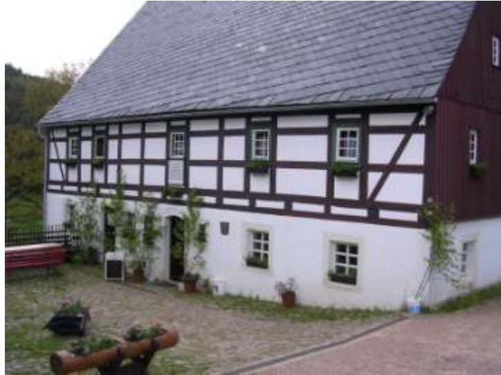
Abb.: Müllermühle mit Glocke Weicheltmühle

An der Weicheltmühle kann man die Tour abbrechen und über den Steilaufstieg zur Kammstraße und Reichenau aufsteigen. An der Bank (siehe Reichenautour) kann man dann wählen, wie man nach Frauenstein zurück möchte – Wegstrecke 10-16km.