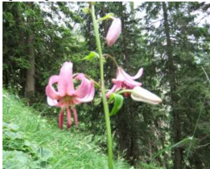
Blüten der Türkenbundlilie

Wenn man die Pombachbrücke überquert hat, nimmt man nicht den Talweg sondern grün die 2,7km über den Lärchenweg und den oberen Teil der Walkmühlenstraße nach zurück Geschätzt: 13km