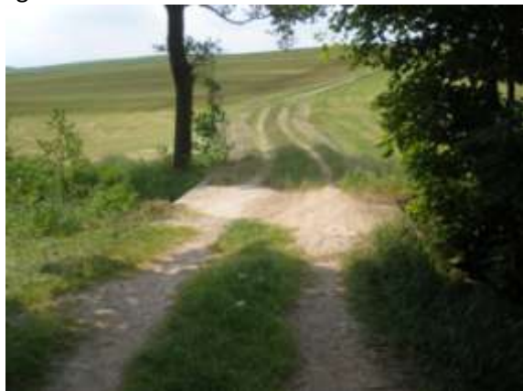
Brücke vor Grünschnöberg