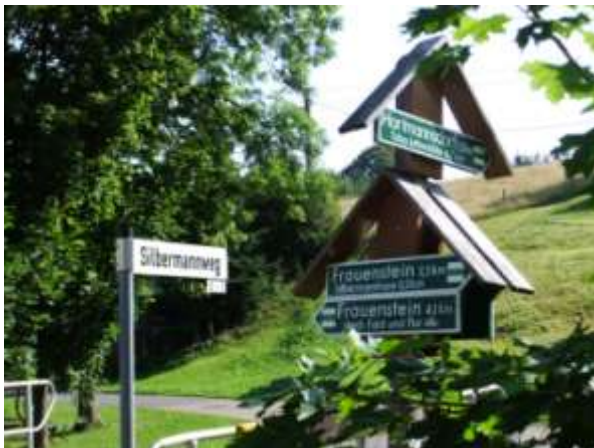
Abb.: Abzweig an der Dorfstraße

Dabei benutzt man auch ein Stück Staatsstraße bis man das Ortseingangsschild und das „Silbermanngeburtshaus“ erreicht hat. Dann geht man links weiter bis auf der rechten Seite auf den Wegweiser trifft. Hier geht man Richtung Hartmannsdorf.