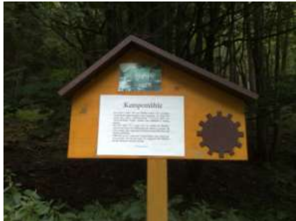
Tafel für Kempemühle

Die erste Mühle war die Kempemühle, die zweite ist die Schillermühle. Man kann etwas versteckt auf der rechten Seite das alte Wasserwerk sehen. Dann mündet der Weg auf die Verbindungsstraße (nicht öffentlich) Frauenstein-Dittersbach. Rechts sieht man eine alte Bogenbrücke, die Pfarrbrücke. Diese überqueren wir nicht, sondern folgen der roten Markierung