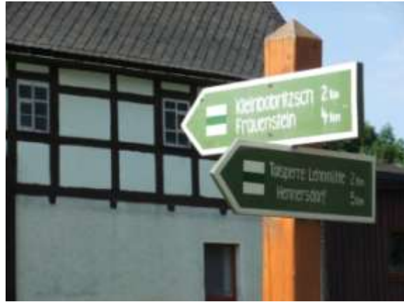
Schilder an der Dorfstraße

Dorfes. Am Ortseingang von Hennersdorf steht ein Schild für die Richtung Frauenstein (3,5km). Man nimmt die Dorfstraße nach findet rechts den Wegweiser mit „2km Talsperre“. Diesem folgt man, aber nur kurz! Einige Meter weiter steht links der Straße ein Wegweiser „Talsperre 30 Minuten“. Den nimmt man auf keinen Fall sondern geht auf der wenig befahrenen Dorfstraße weiter. Dann erreicht man den Abzweig nach Röthenbach/Pretzschendorf an der linken Seite. Man geht aber nach rechts und erreicht mit „etwas“ Glück die „Alte Schanze – 618 m ü. NN“. Scharf nach links geht der Weg nach Hartmannsdorf-Neubau. Man geht aber in den Feldweg nach rechts, der einmal „gelb“ markiert war und zur Ringelmühle führt. Von dort aus hat man die Wahl, am „halben“ Hang gleich nach Frauenstein aufzusteigen oder flussabwärts über die Schafbrück nach Frauenstein zu gelangen. Über Geschätzt: 12-16 km