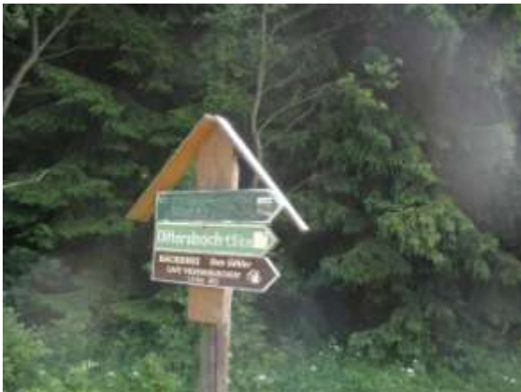
Abb.: irreführender Wegweiser

stromaufwärts. Man folgt diesem Wegweiser nicht!!! Der Wegweiser der „rot“ nach Frauenstein leitet, ist etwas versteckt! So erreicht man den Weg der zu den ehemaligen Mühlen im Gimmlitztal führt, besser zu den Gedenktafeln.