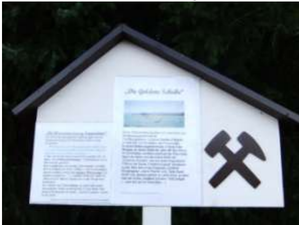
Abb.: Goldene Scheibe

Der „Lange Weg“ windet sich am Waldrand entlang. Man darf nicht nach rechts abwärtsgehen! Dann kommt man an einem bergmännischen Hinweis „Goldene Scheibe“ vorbei, passiert den von