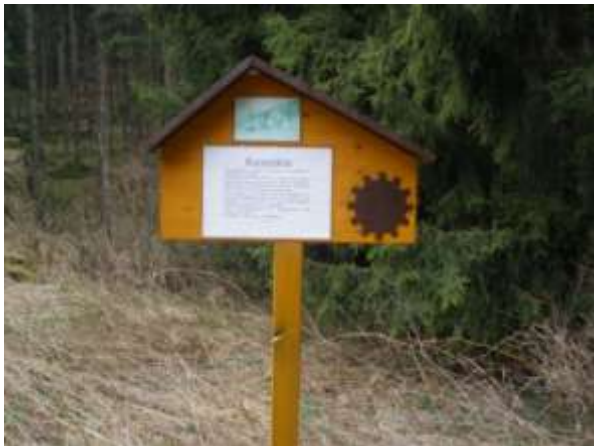
Abb.: An der Ratsmühle

Markierung zum Röthenhübel zu finden. Wer sie gefunden hat erreicht dann den Waldrand, hält sich rechts und geht bei Erreichen eines breiten Weges nach links zum Röthenhübel.