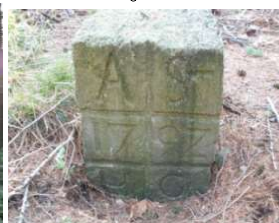
Anton-Stehendes von 1792

Wer diesen Abzweig nicht findet und weiter geht, kommt an einen kleinen Teich und ein Bienenhaus. Das Bienenhaus muss links liegen gelassen werden, es geht etwas steiler bergab, auch dieser Weg endet an der Ratsmühle. An der Ratsmühle hält man sich rechts flussabwärts. Dann überschreitet man die Pombachbrücke. Es geht bergan. Man muss sehr aufpassen, um links die eingewachsene