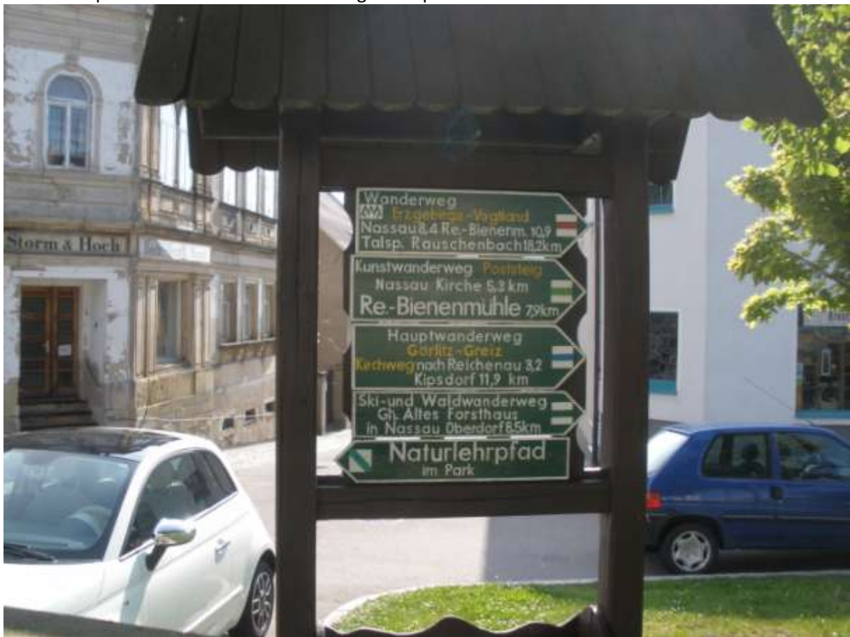
Abb.: Einstieg am Marktplatz

Vom Marktplatz nimmt man den roten Weg zur Teplitzer Straße.