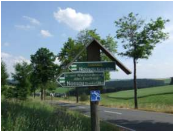
Abb.: B171 in Poststeig

Man lässt den „Wäscheweg“, der nicht ausgezeichnet ist rechts liegen und weiter bis man die B171 erreicht. Hier heißt es auch „Vorsicht“. Für 3 Minuten reger Straßenverkehr