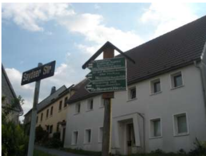
Abb.: Abzweig an der Saydaer Straße

An der Saydaer Straße geht es dann rot weiter.