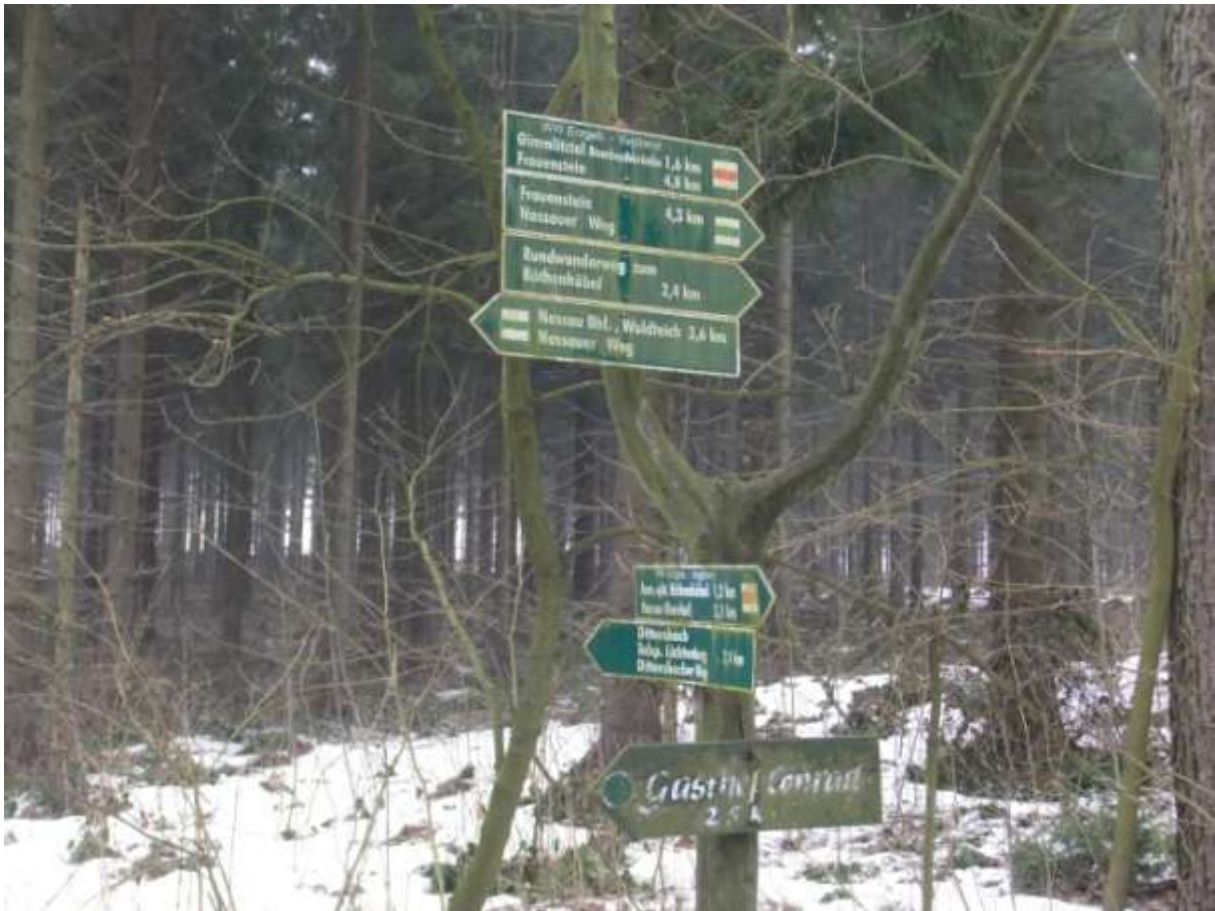
Abb.: Wegweiser zur Bombachbrücke/Pombachbrücke aus Sicht gen Dittersbach

Über die Schreibweise gibt es keine Einheitlichkeit. An vielen Stellen findet man das „B“, weil der Sachse kein „P“ spricht. Der Name geht aber auf den Förster Pombach zurück, der wesentlichen Anteil an der Schaffung des Frauensteiner Schlossparks hatte, auch wenn der Park heute in keinem schönen Zustand ist, besseres Naturschutzgebiet wegen der Türkenbundlilie.