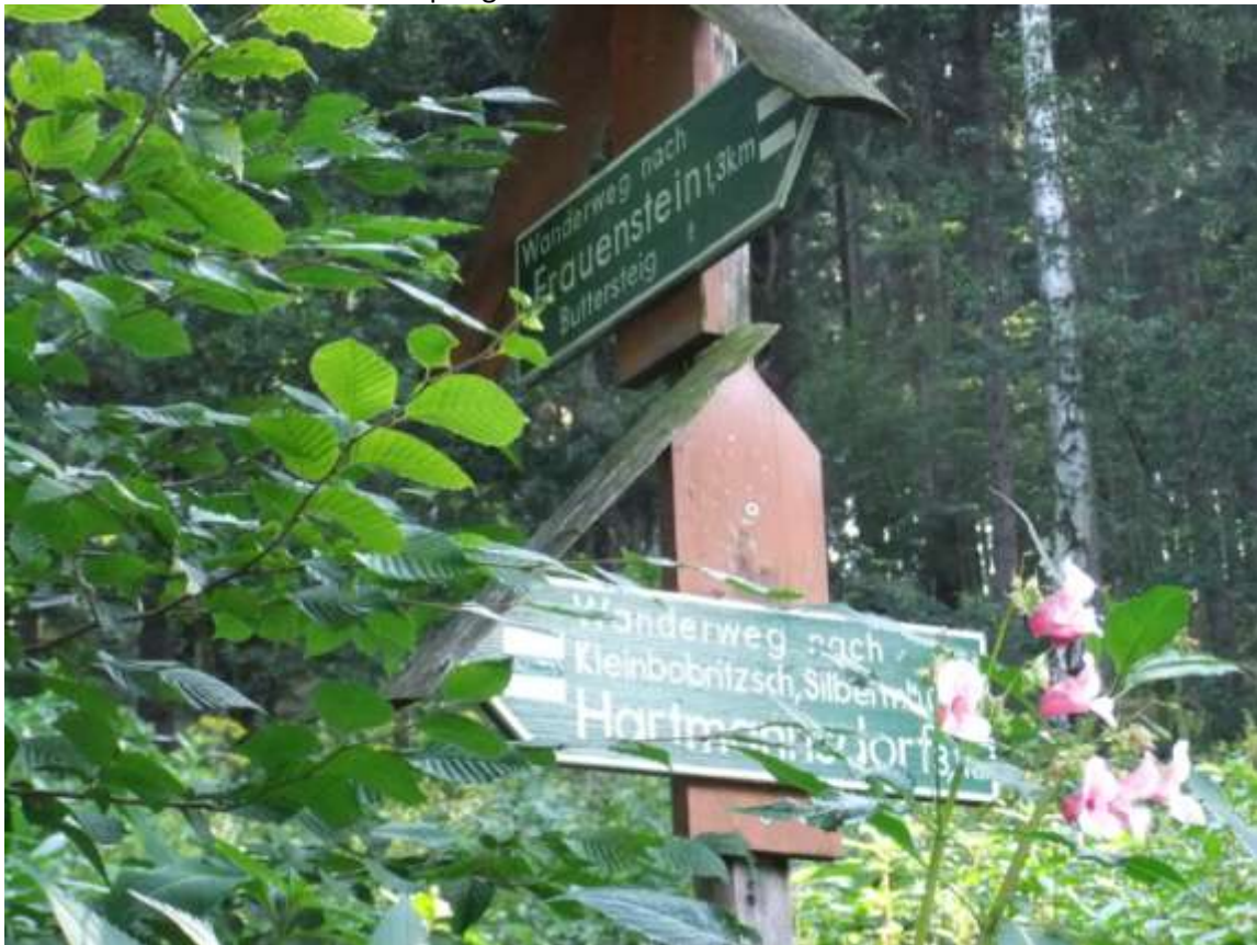
Abb.: Wegweiser an der Schafbrücke

Man folgt der Gasse bis zum Friedhof mit der historischen Kapelle von 1384, dem ältesten Gebäude Frauensteins. Man folgt dem Waldweg, auch als Buttersteig bezeichnet, bis zur Schutzhütte „Großvaterstuhl“, dort geradeaus bis zur Schafbrücke. Diese kleine Brücke überquert die Bobritzsch, die oberhalb von Reichenau entspringt und ca. 100 Meter flussaufwärts den von Frauenstein