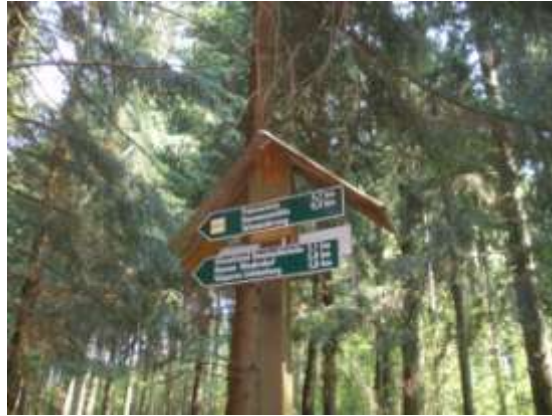
Abb.: Wegweiser am „querenden Weg“