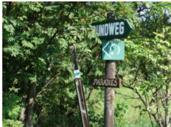
Schilder am „Paradies“

Wenn der asphaltierte Weg am Grundstück Keilig endet hält man sich ohne Hinweisschild links und kommt an eine alte Esche mit schwachem Zeichen. Trotz mehrfachen Bemühens gibt es hier kein Hinweisschild. An der Rückseite steht ein Hinweis „Paradies 10 Minuten“. Dem folgen wir weiter bergan. Am „Paradies“ ist eine schwache Markierung, wir gehen weiter geradeaus.