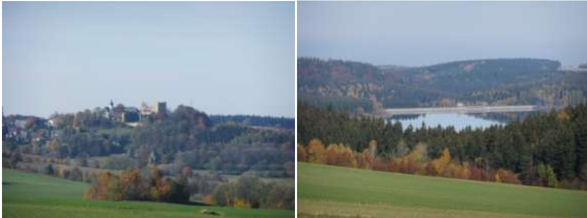
Abb.: Blick nach Frauenstein

Bald steht man an der Quelle der Bobritzsch. Den Weg setzt man fort und bleibt vorerst immer in Richtung „geradeaus“. Man überquert einen besseren Feldweg, der vom Dorf kommt – siehe Abkürzung - und hat am Querweg schöne Aussicht auf den Ort Reichenau (links), Frauenstein mit der Burgruine (halblinks) und auf die Talsperre Lehmühle.