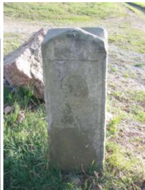
Abzweigstein, alter Standort