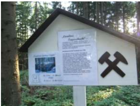
Abb.: Carolina Tagesschacht

rechts kommenden Röhrsteig und steht an einer Waldecke. Links auf der Wiese sehen Kenner ein „Wasserhaus“ in einer nassen Wiese, „Lohses Acker“ genannt. Hier geht es gerade aus weiter, rechts an einer Schutzhütte vorbei. Auf der rechten Seite kommt eine neue bergmännische Tafel: