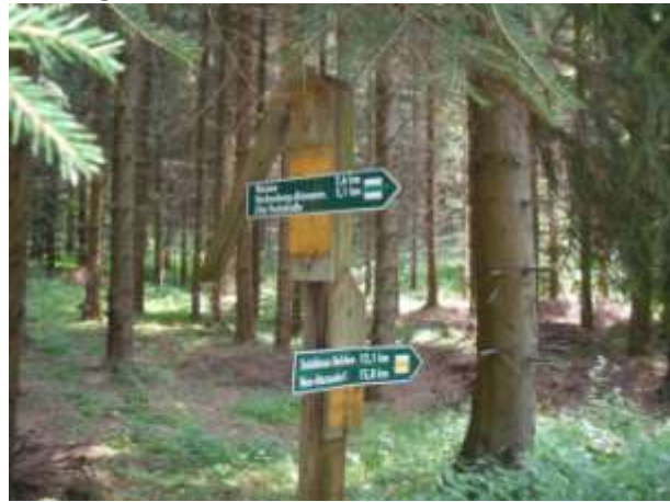
Poststeig im Gimmlitztal

Der Poststeig ist gelegentlich in schlechtem Zustand, das Gras gemährt oder hoch erschwert das Wandern, gutes Schuhwerk ist hier wieder angebracht. Die Traktoren haben in den letzten Jahren den einst gepflegten „Kunsterlebnispfad“ mit Spurrinnen versehen..