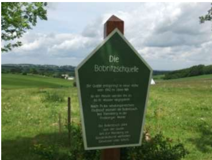
Abb.: An der Bobritzschquelle

Hier sind ca. 14 km gelaufen und man steht 300 Meter weiter an einer Bushaltestelle „Weichelmühle“. Zu Fuß ginge es rechts neben der Bank zur Bobritzschquelle und lt. Reichenautour weiter, also könnten es 20-24 km werden.