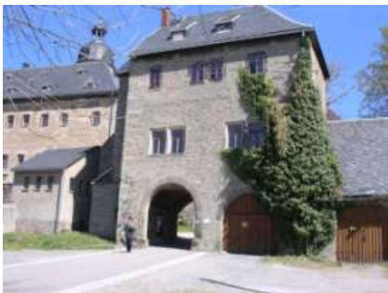
Abb.: Torhaus zum Schloß

Diese Touren sind bei ausreichender Schneelage auch mit Ski befahrbar, allerdings nicht maschinell gespurt.