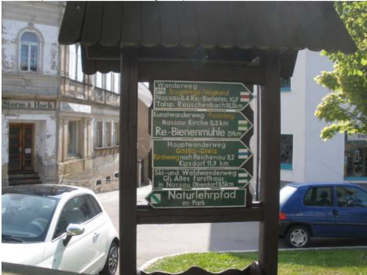
Abb.: Einstieg am Marktplatz

Vom Marktplatz nimmt man den roten Weg zur Teplitzer Straße.